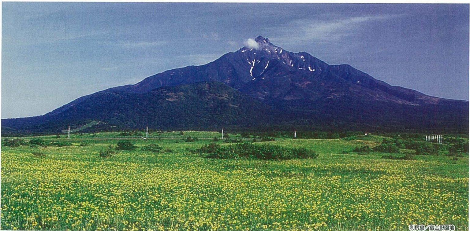
利尻島/富士野園地