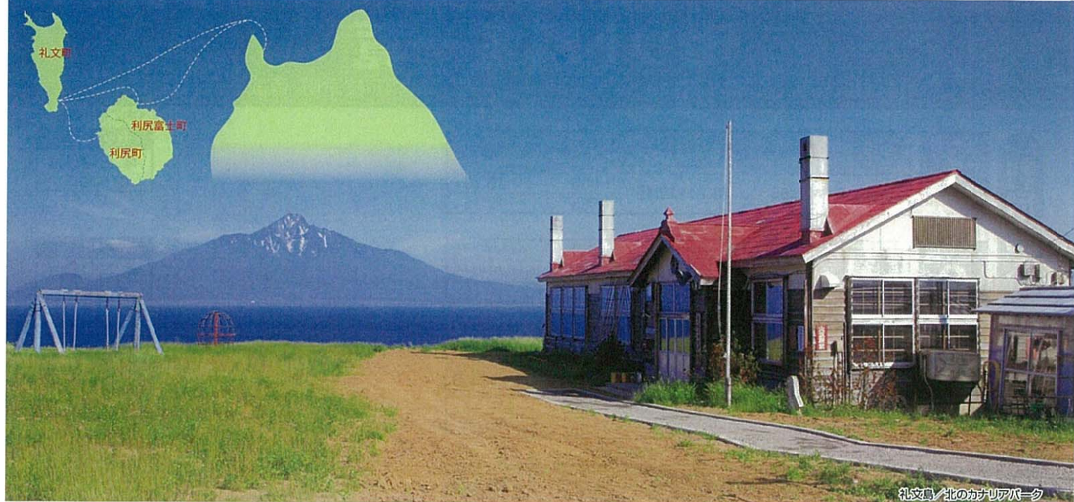
礼文島/北のかナリアパーク